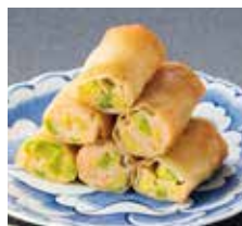
2. アボカドと海老の春巻 1本 385 円 (税込)