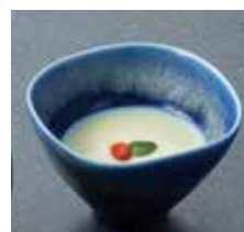
5. ミニ豆乳風味の杏仁豆腐 1個 330 円 (税込)