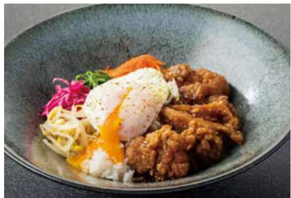
4. 四川風鶏のから揚げ丼、花椒の香り