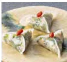
1. 海老蒸し餃子 1個 330 円 (税込)