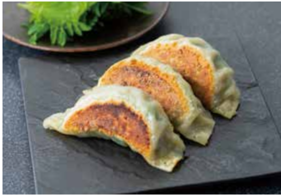
1. Gu-O 特製餃子