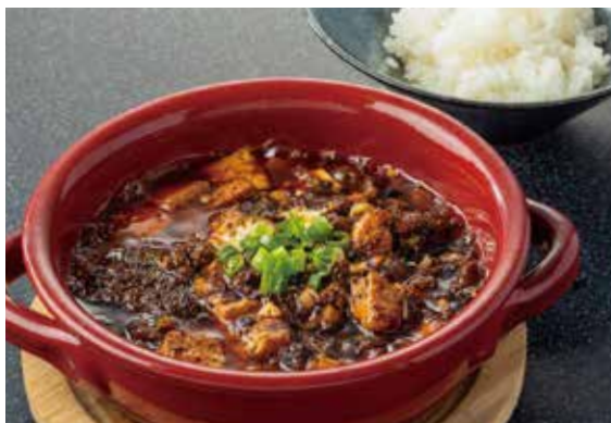
3. 激辛陳麻婆豆腐 (ご飯付)