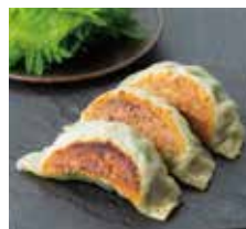
3. Gu-O 特製餃子 1個 275 円 (税込)