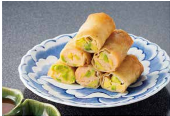
2. アボカドと海老の春巻