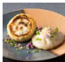
4. 焼き小籠包 1個 330 円 (税込)